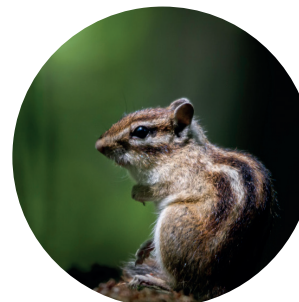
Tamias de Sibérie Tamias sibiricus (Laxmann, 1769)

Les Espèces Exotiques Envahissantes les plus observées sur notre territoire sont la Perruche à collier, le Laurier-palme et le Lilas commun.