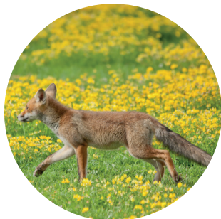
Renard roux, Vulpes vulpes (Linnaeus, 1758)