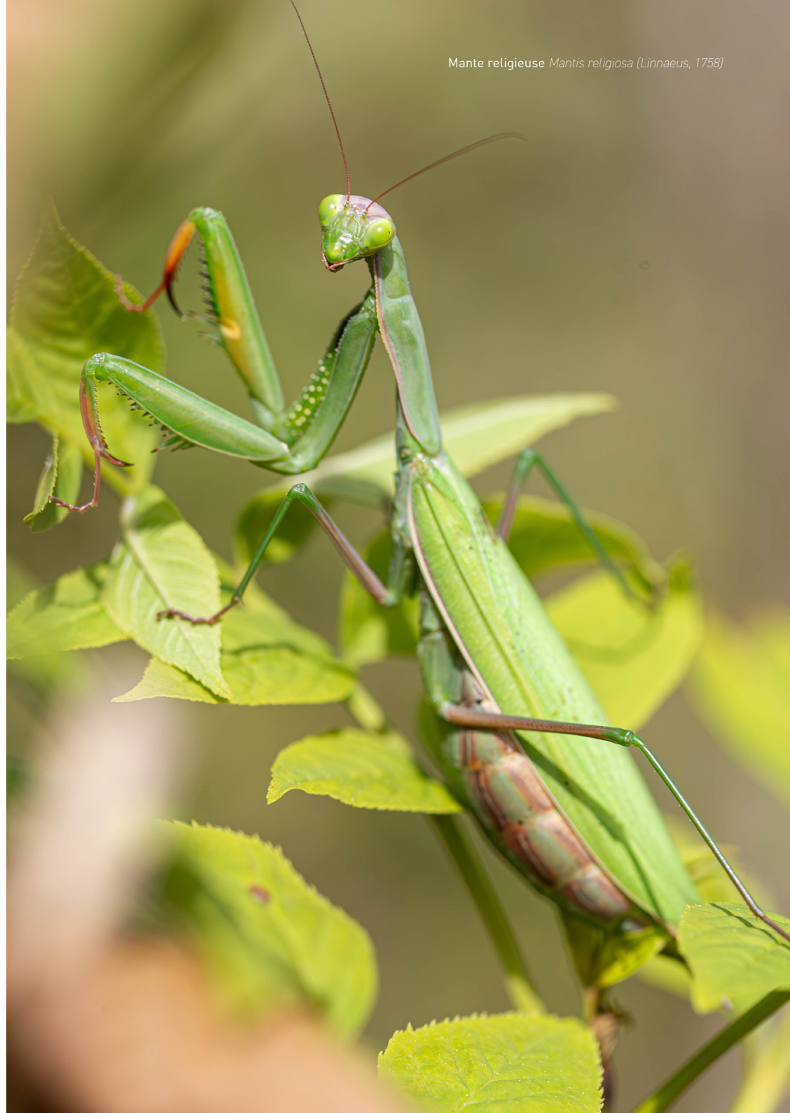
Mante religieuse Mantis religiosa (Linnaeus, 1758)