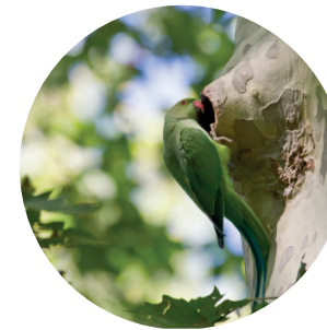
Perruche à collier Psittacula krameri (Scopoli, 1769)

La dernière observation du loup gris sur le territoire date de mai 1798