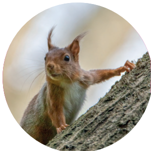
Écureuil roux Sciurus vulgaris (Linnaeus, 1758)

Un taxon désigne un de ces différents ensembles, le plus souvent on utilise le mot taxon pour désigner les espèces, les sous espèces voire le genre.