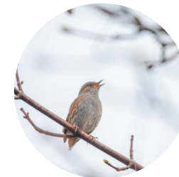
Accenteur mouchet Prunella modularis (Linnaeus, 1758)

Ces espaces ont vocation à être ouverts au public, en tout ou partie, ceci dans un objectif de sensibilisation aux enjeux écologiques et de préservation de ces milieux.