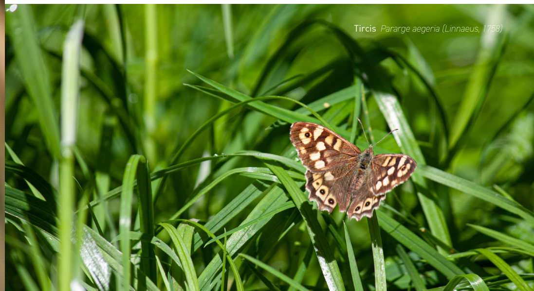
Tircis Pararge aegeria (Linnaeus, 1768)

La dernière observation du loup gris sur le territoire date de mai 1798