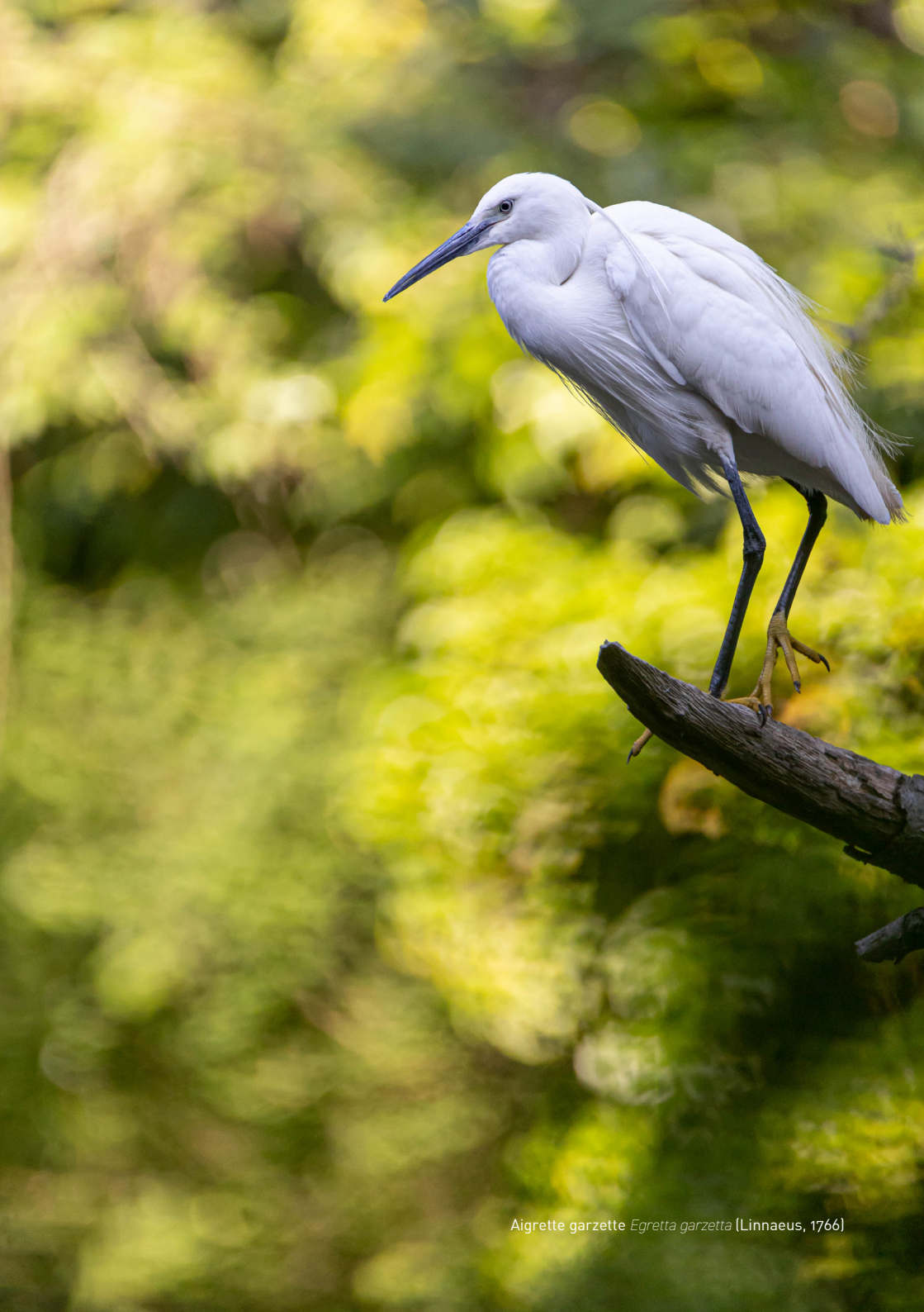
Aigrette garzette Egretta garzetta [Linnaeus, 1766]