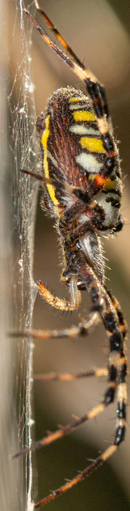
Epeire frelon Argiope bruennichi (Scopoli, 1772)

L'Accenteur mouchet, une espèce protégée et patrimoniale, ainsi que le Faucon crécerelle, également espèce protégée, ont pu être observés sur les neuf communes de l'agglomération.