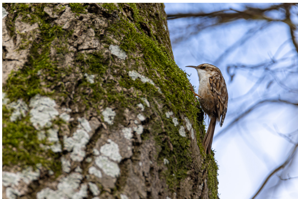
Grimpereau des jardins Certhia brachydactyla (C.L. Brehm, 1820)

Enfin il est important de comprendre que la lecture de la continuité écologique ne doit pas se limiter au territoire. Ces réseaux appelés trames vertes et bleues sont également en lien avec le Lac de l'Essonne à Viry-Châtillon, Le Parc de Trousseau à Ris-Orangis, la vallée de l'Orge au niveau de Juvisy-sur-Orge et d'Athis-Mons.