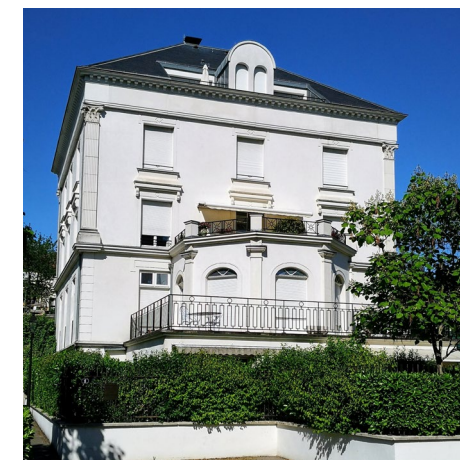
La Gerbe d'Or

Qu'a immortalisé sur toile Claude Monet lors de son passage à Yerres, en 1876 ?