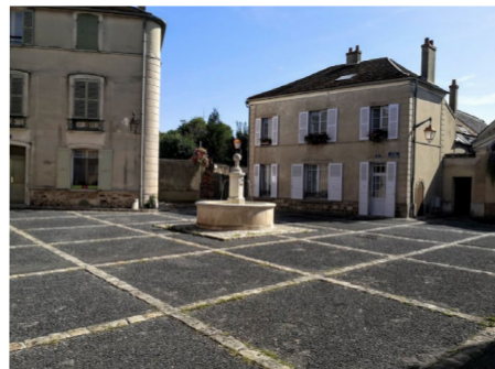
Place Sainte Eutrope

Quelle décoration honorifique française a été remise pour la première fois à Crosne ?