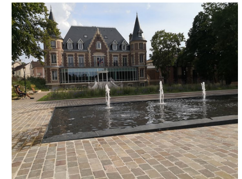
Mairie et ses jeux d'eau

Qu'est-il arrivé au lavoir d'Epinay-sous-Sénart, au début de la 2 e Restauration, après la défaite de Waterloo, en 1815 ?