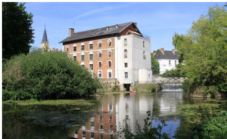
Moulin de Brunoy

Quel peintre rouennais a signé le tableau « La Vierge à l'Enfant » se trouvant dans une église brunoyenne ?