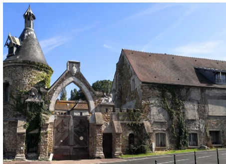
Moulin de Senlis