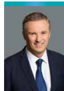
Nicolas DUPONT-AIGNAN YERRES Conseiller municipal Député de l'Essonne