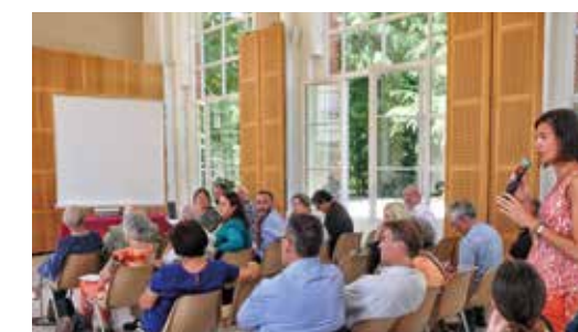
Réunion tourisme du 28 juin 2018

La méthode d'ensemble qui permettra de répondre à la question finale: « Comment valoriser nos atouts pour faire prospérer le tourisme en Val d'Yerres Val de Seine au bénéfice de tous ? » sera construite collectivement.