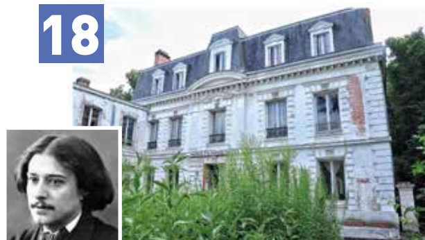
18 LA MAISON DAUDET À DRAVEIL