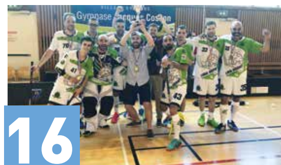
16 LES LIONS SONT À BRUNOY !