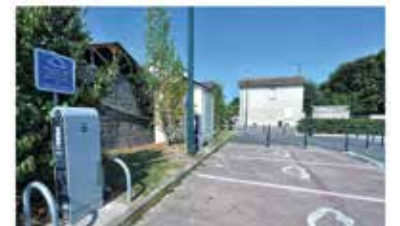
Parmi les actions déjà engagées en faveur du multimodal, la ville installe des bornes de recharge pour les voitures électriques (ici la station du parking Foch) et à chaque renouvellement de véhicules municipaux c'est l'électrique qui est privilégié. « y compris pour le maire qui roule en Zoé. »