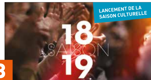
8 SAISON CULTURELLE

Directeur de la publication : François Durovray Rédacteur en chef : Laurent Sauerbach Rédaction : Laurent Sauerbach, Graziella Riou, Emmanuelle Borrás, Rodolphe Trujillo, Véronique Salon, Conception graphique : Véronique Salon Nombre d'exemplaires : 75000 ex. Dépôt légal : 6665P Fabrication et impression : Desbouis-Grésil à Montgeron Imprimé sur papier issu de forêts gérées durablement par un imprimeur agréé.