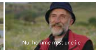
Nul homme n'est une île