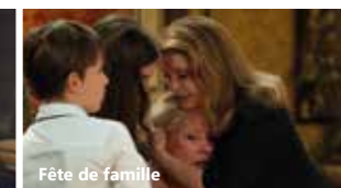
Fête de famille