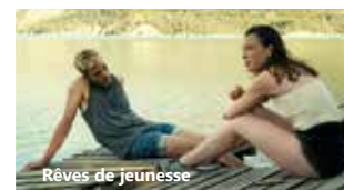
Rêves de jeunesse

Cinéma intercommunal Communauté d'agglomération Val d'Yerres Val de Seine